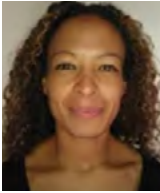
S Kalenzaga CERCA UMR 7295, Équipe Vieillessement et Psychopathologie de la Mémoire (ViPsyM), Université de Poitiers/CNRS