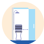
Douche de plain-pied